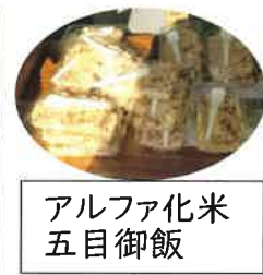
アルファ化米 五目御飯