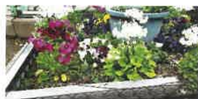
サクラソウとパンジー