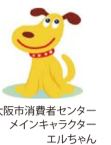
大阪市消費者センターメインキャラクター エルちゃん

「スマホでSNSの広告を見て、化粧品を1回だけのつもりで購入したが、定期購入契約になっていた」などのトラブルが増えています。困ったら、気軽にご相談ください。消費生活相談は市内在住の方に限り、☎・面談(事前予約制)・✉で行っています。 ☑ 月～土曜10:00～17:00(祝日除く) ☑ 大阪市消費者センター消費生活相談専用電話 ☎06-6614-0999 ☎06-6614-7525