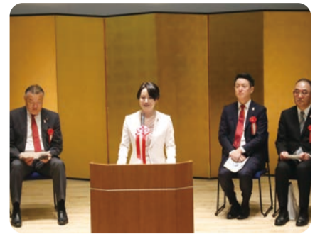
完成記念式典では、港区土地区画整理事業の歴史をお伝えしました。図書館にある事業の記念展示スペースもぜひご覧ください。

さて、5月号の特集は「自転車マナーの向上」です。港区長になって3年目、あちこちで聞かれるのは「港区は自転車で走りやすいまちなので、どうしてもスピードが出てしまう」ということです。信号を守り、広い道に出るところでは必ず一旦停止をして左右を見る、そして「自転車用ヘルメットをかぶる」ことを、ぜひともお願いしたいです。大阪・関西万博まで1年を切りました。安全・安心な港区で世界中の人を迎えたいですね！