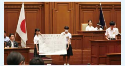
昨年の様子(中学生市会)

市長に質問や提案をするために、議員になってみませんか。対象は市内在住または在学の小学5・6年生。定員81人。