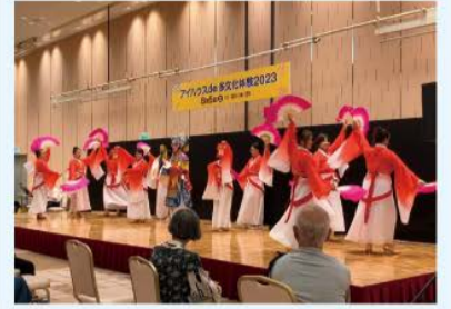
昨年の様子(中国の京劇)

日本在住の外国人による言葉、文化、料理の紹介や、伝統楽器の演奏、踊り、劇などを楽しめるイベントを開催。さまざまな文化への理解を深めましょう。