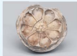
難波宮造営以前の素弁八葉蓮華文軒丸瓦 難波宮跡出土 7世紀前葉 大阪市教育委員会蔵

なにわのみや 難波宮跡の第1次発掘調査開始から70年の節目を記念した特別展を開催。発掘調査成果を中心に、周辺資料や伝承をまじえながら、難波宮の画期性と「大化改新」のかかわりを分かりやすく紹介します。