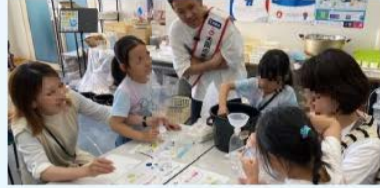
水に関する実験の様子

水に関するワークショップや体験型のイベント、謎解きなどを開催。対象は未就学児～小学生。定員各回70人。