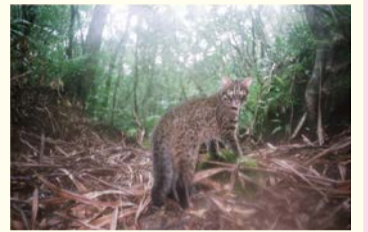
イリオモテヤマネコ

📞 大阪市総合コールセンター ☎06-4301-7285 FAX06-6373-3302