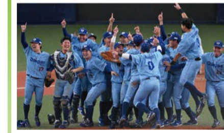
昨年優勝チーム：大阪ガス硬式野球部

全32チームが出場し、社会人野球の日本一を決定する最高峰の大会のチケットを1,000人にプレゼント。詳しくはHPをご覧ください。 日 10/29(火)~11/17(日)のうち12日間開催 場 京セラドーム大阪 申 10/16までにHPで。 問 経済戦略局スポーツ課 ☎06-6469-3882 ☎06-6469-3898