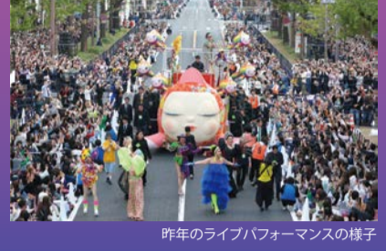
昨年のライブパフォーマンスの様子

実施エリアを拡大し、大阪のメインストリート・御堂筋を唯一無二のプログラムで彩ります。ダンスなどのライブパフォーマンスを通じて、この日限りの非日常をお楽しみください。 日 11/3(日・祝) 14:00~16:00(予定) 場 御堂筋(淀屋橋交差点~船場中央3交差点)