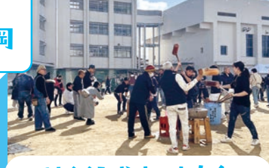
はぐくみやまいも大会

コロナ禍で中止が続いていましたが、 今年の1月に久々の開催となりました。 市岡小学校にてホクホクの焼きい もやつきたてのおもち、豚汁を食べ ることができます。工作コーナーや消防 体験などもあり、盛りだくさんのイ ベントです。