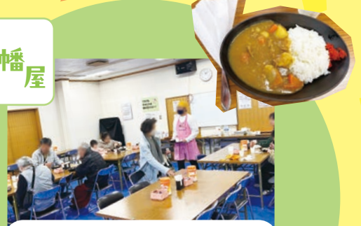
八幡屋カレー食堂

奇数月第2日曜日に開催されていま す。子どもから高齢者までたくさん の方がお越しになっています。