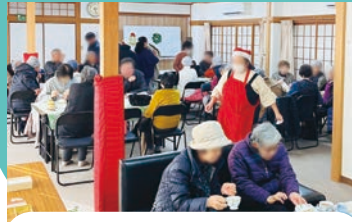
ふれあい喫茶 (ぼっぼ)

毎月第2土曜日に市 岡元町憩の家で開催 しています。食事を 通してみんなが気軽 に交流できる場所に なっています。