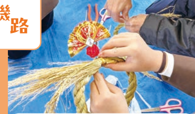
小学生とのしめ縄作り

磯路小学校の児童と毎年恒例の 「しめ縄作り」。小学生や先生方、 多くの地域の方が協力しながら 作成し、世代間交流として好評な イベントの1つとなっています。