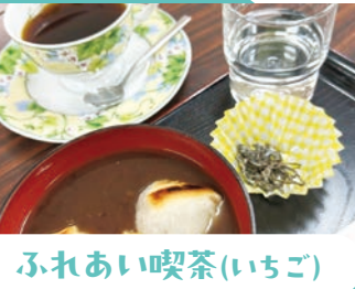
ふれあい喫茶 (いちご)