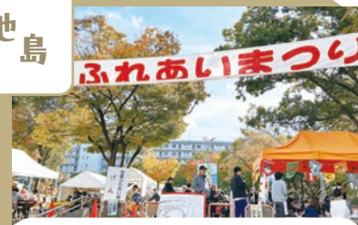
池島ふれあいまつり

毎年11月23日の勤労感謝の日に開 催される池島地域最大のお祭りデ す。ステージやたくさんの模擬店が 出店されており、一日楽しむことが できるイベントです。