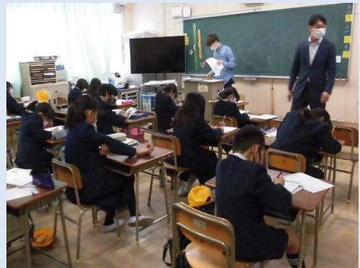
(参考) 令和2年度 小学生放課後学習支援事業

民間事業者への委託により、区内全9地域に小学生を対象とした居場所を開設・運営する。