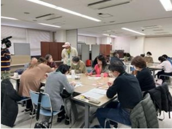
【第2部 グループワークの様子】

2月11日（土曜日）にこども食堂に関するワークショップを開催。40名が参加されました。第1部ではこども食堂の運営等に関する講演会、第2部ではグループワークを行い、参加者による活発な意見交換が行われました。