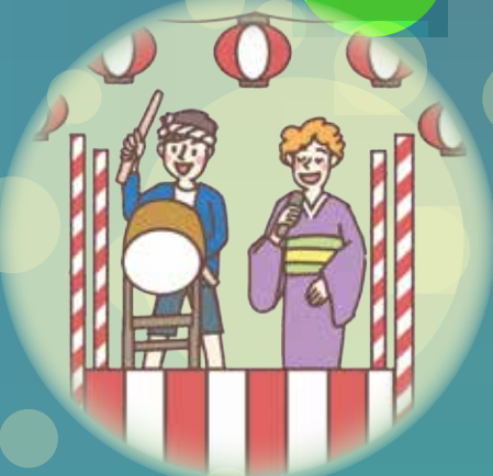
まつり・ レクリエーション