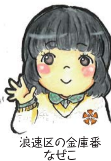
浪速区金庫番 なせこ

「この予算は妥当なのか、無駄はないのか」とか、予算担当としても厳しい目でチェックしています。こう見えて厳しいねん!