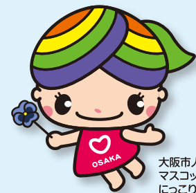
大阪市人権啓発 マスコットキャラクター にっこりーな