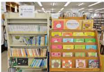
「食べ物」が題材の絵本を集めました!