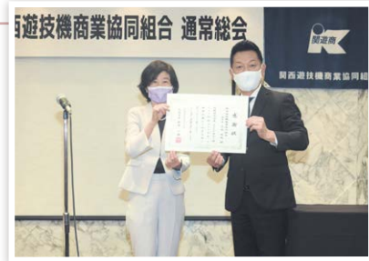
寄附防犯カメラ 感謝状贈呈式

引き続き、浪速区では街頭犯罪ゼロを目標として、地域の皆さんや民間事業者の皆さんと力を合わせ「安全で安心なまちづくり」を進めていきます。