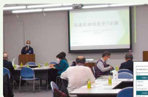
浪速区地域見守り会議