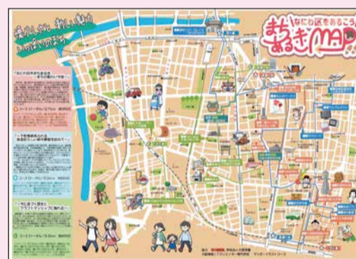
なにわ区まちあるきMAP