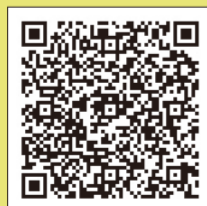
大阪市防災アプリ

気象情報等の防災情報は、テレビやラジオ、緊急速報メールなど、様々な方法で皆さまにお知らせします。次の二次元コードより各サイトをお気に入りやブックマークに登録しておくとう便利です。