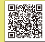
大阪府河川防災情報