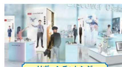
リボーンチャレンジ