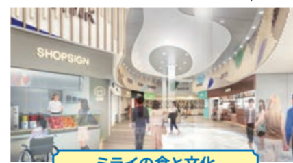
ミライの食と文化