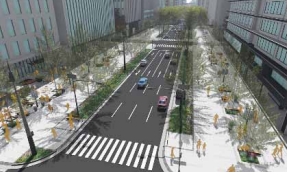
御堂筋の側道歩行者空間化イメージ▶