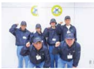
にっしーパトロール隊 メンバー

私たち、にっしーパトロール隊は自転車・青色防犯パトロールカー(青パト)を活用し、お子さんの安全と元気な姿を見守るため、通学路や公園などの巡視を行い、子どもたちを見かけたらあいさつするなど、「安全安心なまち 西区」をめざし、取り組んでいます。