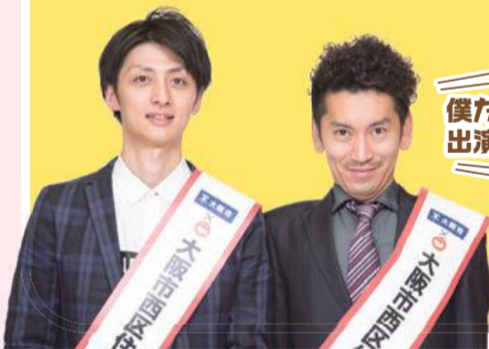
動画撮影時の様子