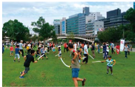
昨年の体験型アクティビティの様子

水辺の芝生で楽しく過ごす「クラフトピック」や体験型アクティビティといった親子で楽しめる外遊びなど、中之島公園を中心に水辺に親しむプログラムを多数展開。詳しくは HP をご覧ください。