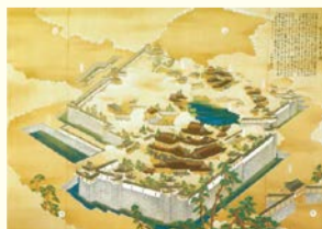
聚楽第図(大阪城天守閣蔵)