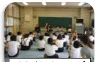
オリックスパファローズ