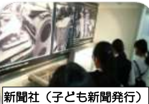
新聞社(子ども新聞発行)