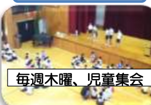
毎週木曜、児童集会