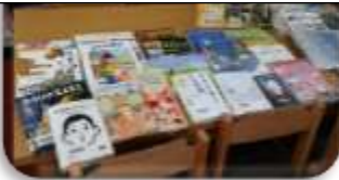
いきいき図書の本