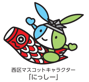
西区マスコットキャラクター「にっしー」