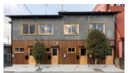
改修イメージ(改修前→改修後)

に要する費用等の一部を補助します。補助内容など詳しくはHPをご覧ください。 問 都市整備局耐震・密集市街地整備受付窓口 ☎ 6882-7053 FAX 6882-0877