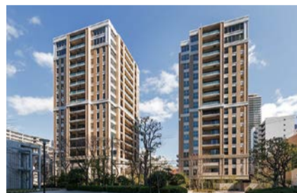
第34回ハウジングデザイン賞 受賞住宅 ※他に特別賞受賞住宅もあり

魅力ある良質な集合住宅を表彰する「大阪市ハウジングデザイン賞」を実施。推薦いただいた方の中から抽選で50人に図書カード(500円分)をプレゼント。 問 市役所・区役所・大阪市サービスカウンター(梅田・難波・天王寺)などで配布する推薦ハガキ付きリーフレットに必要事項を記入し、6/20までに都市整備局住宅政策課へ送付。HPからも申し込み可。 ☎6208-9226 FAX6202-7064