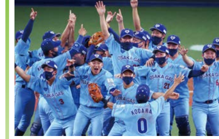
前回優勝チーム:大阪ガス

全32チームが出場し、社会人野球日本一を決定する最高峰の大会のチケットを500組1,000人にプレゼント。対象は市内在住・在勤・在学の方。詳しくは☎をご覧ください。 ☎ 10/30(日)～11/9(水)の間で開催(予定) ☎ 京セラドーム大阪 ☎ 10/17までに☎で。 ☎ 経済戦略局スポーツ課 ☎ 6469-3882 FAX6469-3898