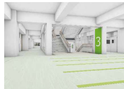
内観イメージ図 （詳細は今後変更の可能性がありますが）