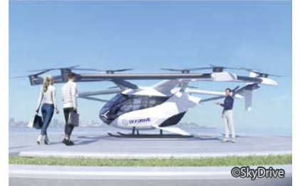
空飛ぶクルマの機体イメージ