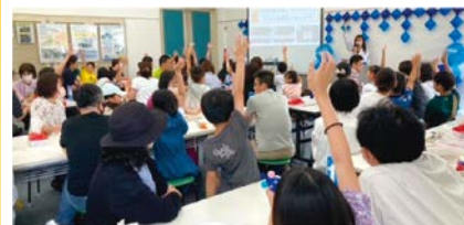
クイズ大会の様子

小学生を対象に、水に関するワークショップや体験型のイベント、謎解きなどを開催。定員各回70人。