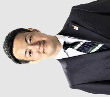
大阪市長 横山 英幸