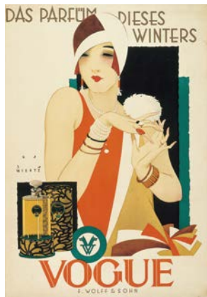
ユップ・ヴィールツ《ヴォーグ、今年の冬の香水はこれだ》1925年 サントリーポスターコレクション(大阪中之島美術館寄託)

アール・デコ博100周年を記念して開催。「アール・デコと女性」をテーマに、女性が描かれたヨーロッパのグラフィックデザイン作品や、女性と関わりの深いジュエリー、香水瓶、ドレス、車など、当時を象徴する数々の貴重な作品や資料を展示します。