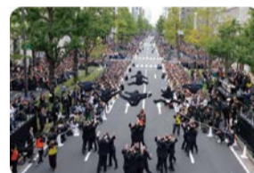
御堂筋魅力創出・発信事業のイメージ