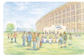
夢洲第2期区域 記念公園ゾーンイメージパース