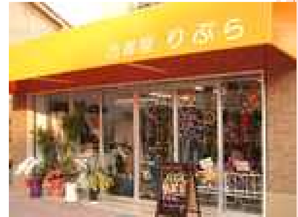
りさいくるショップりぷら