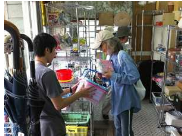
りさいくるしょっぷ ねこまる