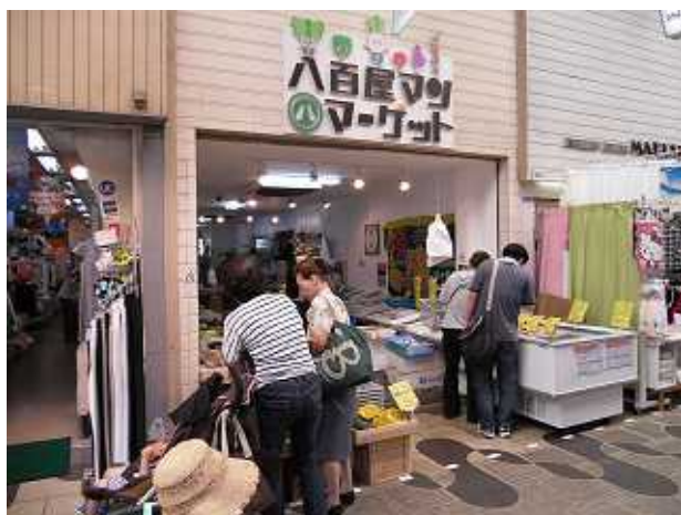
八百屋マンマーケット