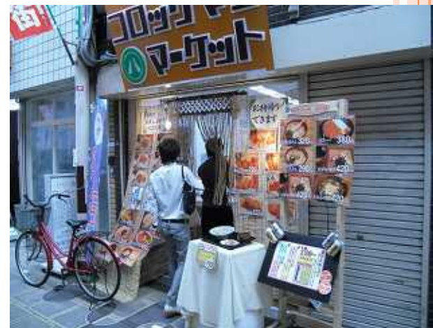
コロッケマンマーケット