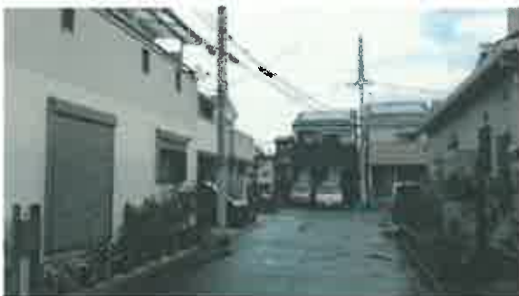
売却済み市有地の現状(20131209) ○940 販売住宅