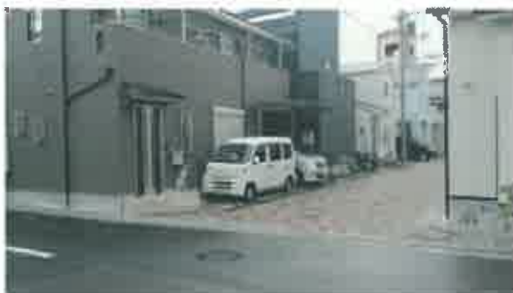
売却済み市有地の現状(20131209) ○1026、1027 販売住宅