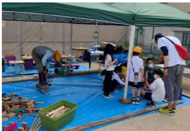
こどもの里 プレーパーク