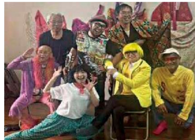
フリーダムダンス釜