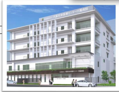
新病院イメージ図 →