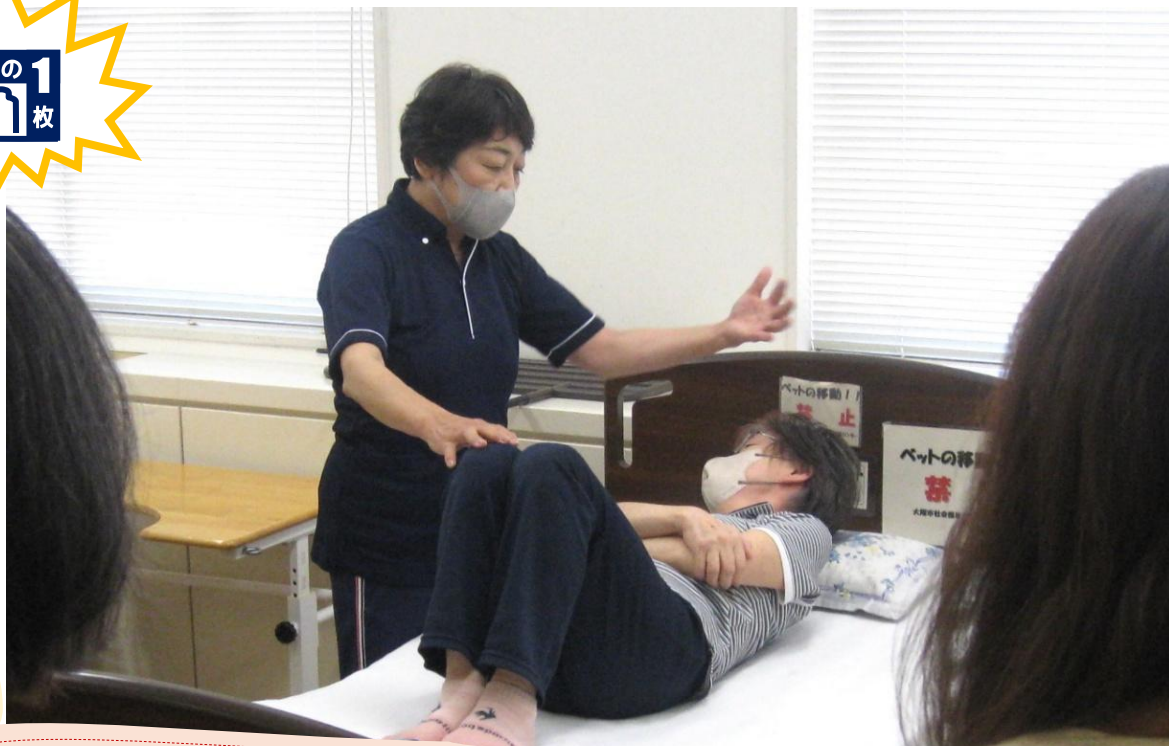
大阪市社会福祉研修・情報センターで開催の「介護実習講座（入門コース）」の様子です。市民のみなさま向けの研修で、「家庭における介護の基本」を学んでいただけます！