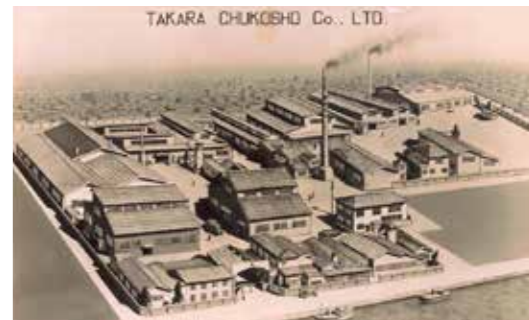
1959年頃の宝鑄工所。木津川沿いに船が往き来する姿が伺えます。1950年3月13日の大阪空襲で被災後、再建に立ち向かっています。