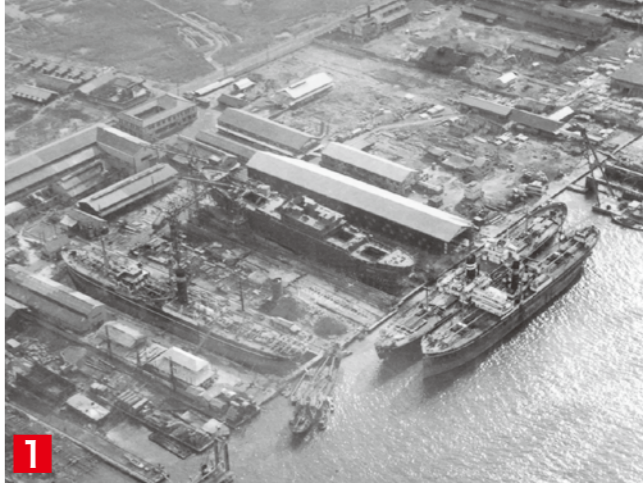
1 1953年頃、南津守のサノヤス造船所。大型貨物船「第五満鉄丸」を建造中。工場周辺は湿地でした。