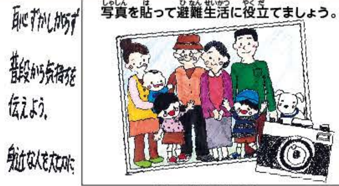
※表紙は鶴見橋中学校の生徒さんがデザインしました。