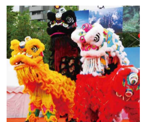
昨年の中秋明月祭大阪2017の様子

場 史跡難波宮跡 問 経済戦略局国際担当 ☎6615-3742 FAX6615-7433