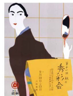
早川良雄「第11回秋の秀彩会」大阪新美術館建設準備室蔵

大阪新美術館建設準備室のコレクションである関西発のユニークな広告雑誌「プレスアルト」の戦後刊行分や、大阪市・大阪府収蔵の広告ポスターから、戦後の関西における広告とデザインの新たな魅力を紹介し、