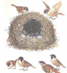
『ぼくの鳥の巣コレクション』 絵と文 鈴木まもる(岩崎書店)より

絵本作家であり、鳥の巣研究者として知られる鈴木まもるさんが世界中から集めた実物の鳥の巣を紹介しながら、絵本への思いや自然の不思議について語ります。定員300人(先着順)。 日 11/25(日)14:00~16:00