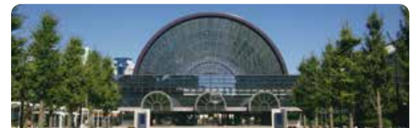
会場予定地: インテックス大阪(大阪国際見本市会場)

日本初開催の「G20サミット首脳会議」開催地が大阪に決定。2019年に約35か国・機関が大阪に集います。☎経済戦略局国際担当 ☎6615-3757 ☎6615-7433