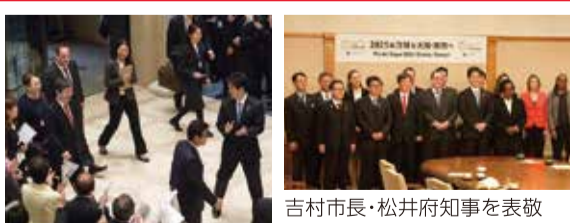
大阪市役所での歓迎の様子