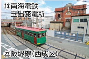
13 南海電鉄 玉出変電所