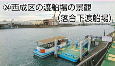
24 西成区の渡船場の景観 (落合下渡船場)

「都市景観資源」とは？ 市民に親しまれ、各区を象徴する都市景観を形成している建築物や樹木等を、大阪市都市景観条例に基づき市長が登録するものです。