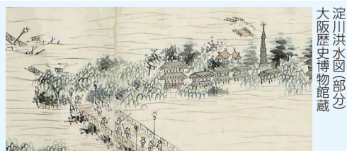
淀川洪水図(部分) 大阪歴史博物館蔵

日6/25(月)まで9:30~17:00(入館は16:30まで)火曜休館 場問大阪歴史博物館 ☎6946-5728 FAX6946-2662