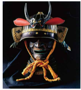
三十二間総覆輪阿古陀形筋兜 [大阪城天守閣蔵]

天守閣の収蔵品の中には、さまざまな「顔の表現」のあるものが含まれます。目を凝らさないとわからないような細かい技巧、見るものの心に働きかける豊かな表情など、多種多様な顔が見られる資料を集めました。7/19(木)まで9:00~17:00(入館は16:30まで) 場問 大阪城天守閣 ☎6941-3044 FAX6941-2197