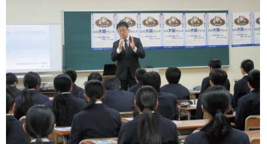
市立南港南中学校での開催風景▶