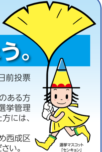
選挙マスコット「センキョウ」