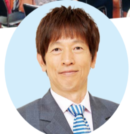
よしもと 芸人 ちやらんぼらん富好さん も来場します!

※上記はいずれも整理券が必要です。(13:00、14:00、15:00、の3回に分けて配付します) 他にも、子ども薬剤師調剤体験・肌水分測定・チェアエクササイズなど、大人も子どもも楽しみながら健康づくりに役立つ体験・展示などがいっぱい!