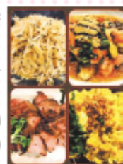
当店はメニュー表はありません。