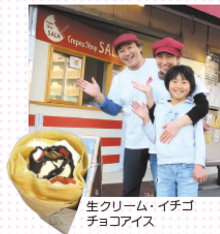
生クリーム・イチゴ チョコアイス

子育てと仕事を両立、子どもとの時間を大切にしたいから…、お店や、教室を開いています。いちど来てください!