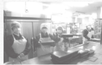
厨房補助 手洗い、マスクと帽子やエプロンの着用も完璧です。

総合生活相談、生活・就労支援のさまざまな事業のうち、自立訓練の2年間のプログラムの一部を案内していただきました。 3階の食堂では厨房補助として毎日の昼食時にお弁当と食券とを交換するサービスマンや、味噌汁給仕、お皿洗いなどの実践。2階のパソコン教室ではタイピングの練習などすぐに就労に役立つ内容でした。