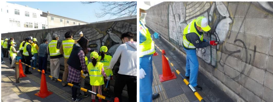
落書き消去活動の様子

ご利用をお考えの方は、 西成区役所市民協働課（西成区役所7階73番窓口 6659-9734） までご相談ください。