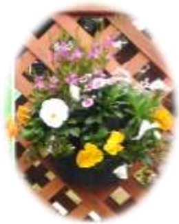
昨年度の作品 (ハンギングバスケット)

申込方法：電話・FAX・はがき・窓口等で①氏名②連絡先③住所 ④受講を希望する回をお知らせください。